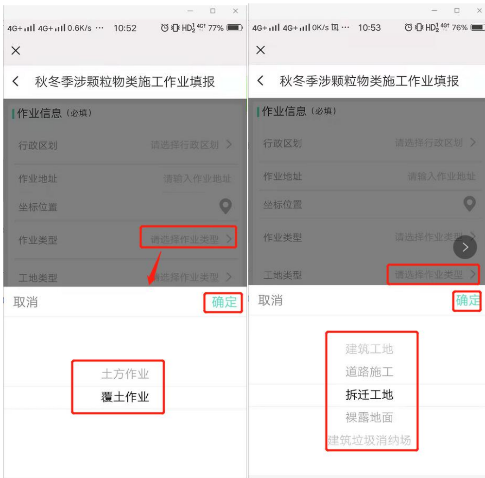
图 1- 12